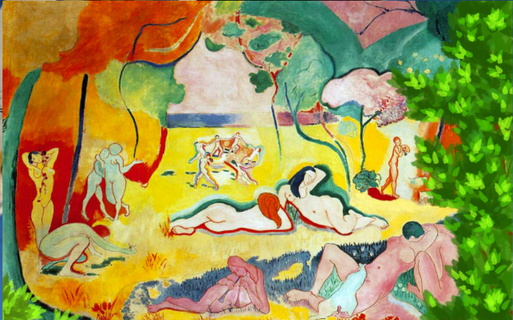
Gioia di vivere, Matisse