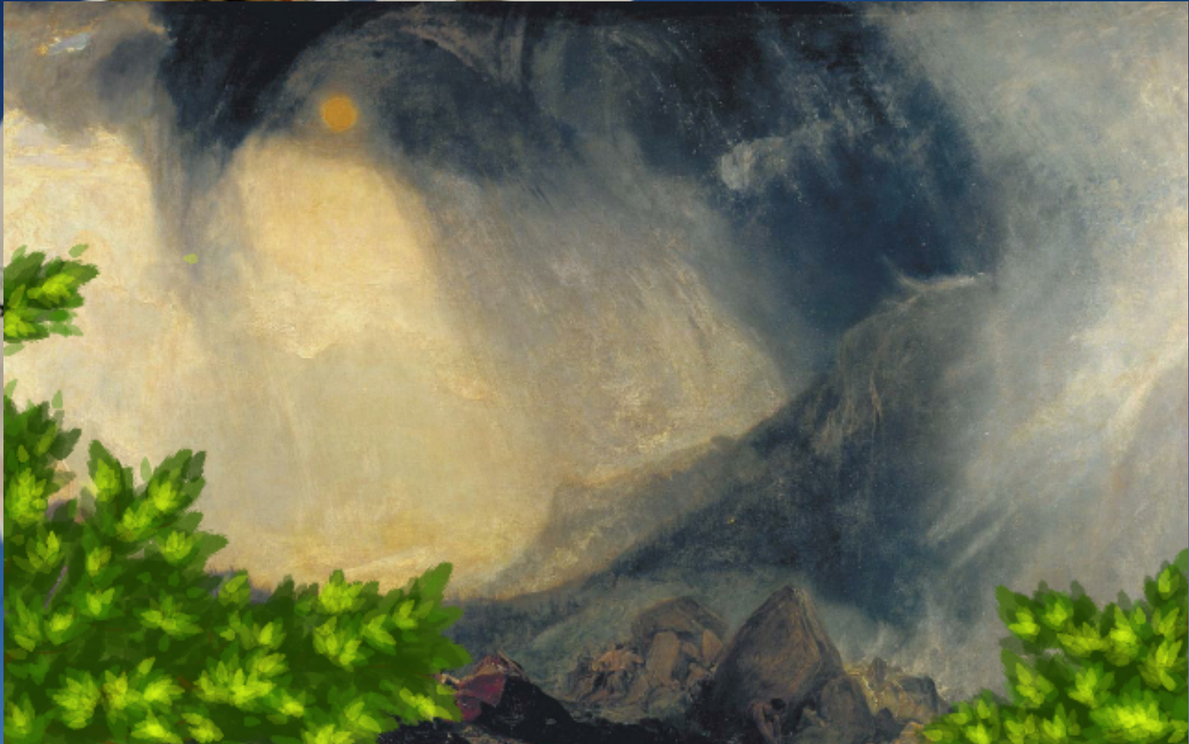
Bufera di neve: Annibale e il suo esercito attraversano le Alpi, Turner