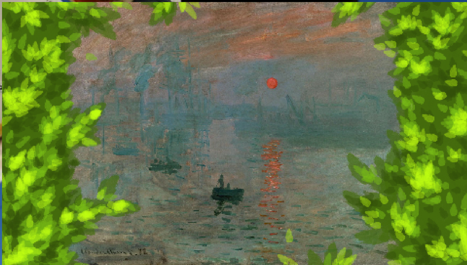
Impressione, Levar del Sole, Monet