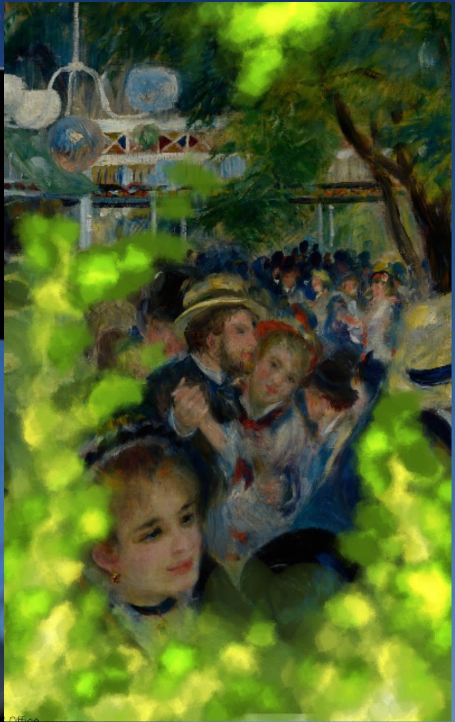
Bal au Mulin de la Galette, Renoir