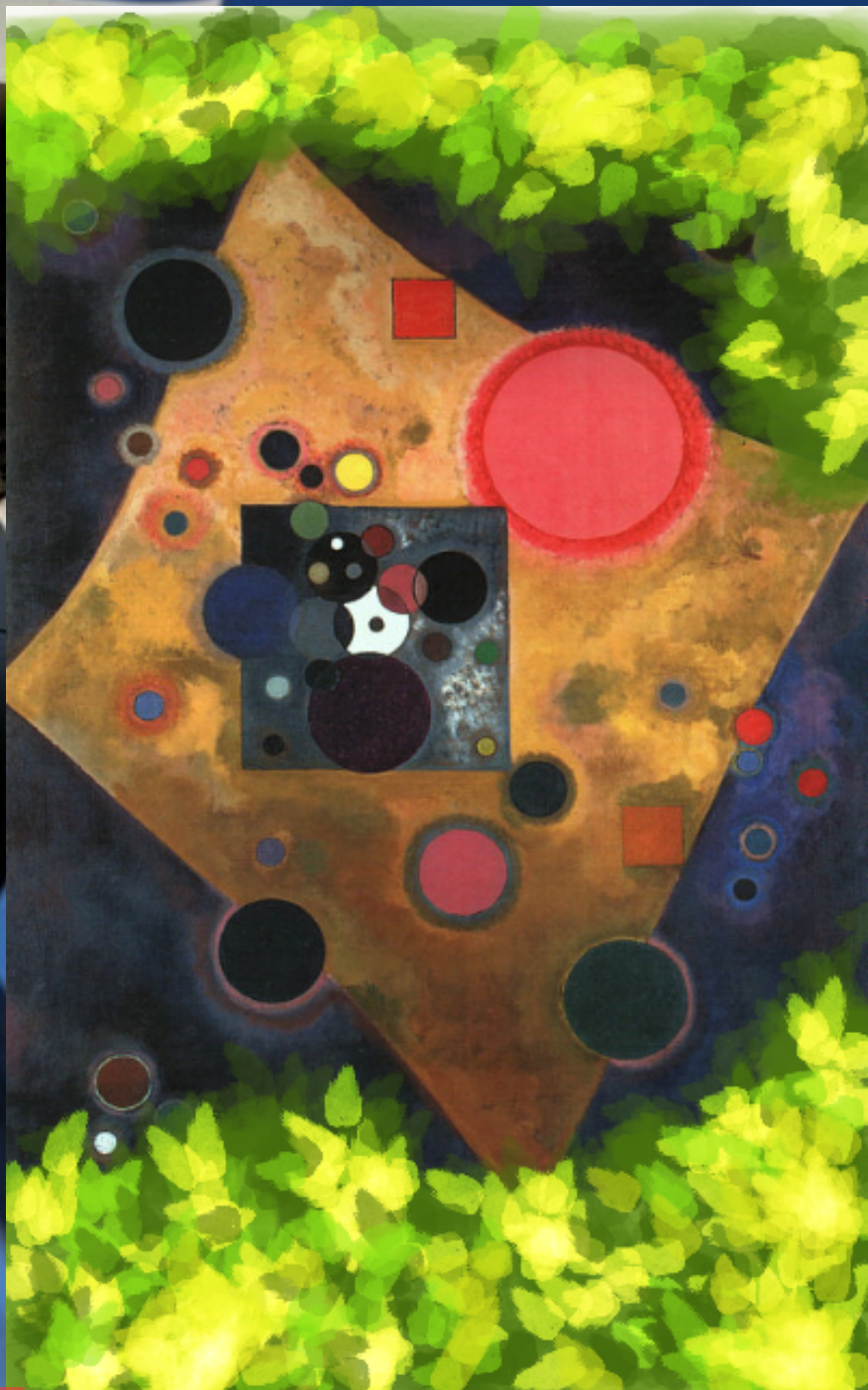
Accento in rosa, Kandinskij